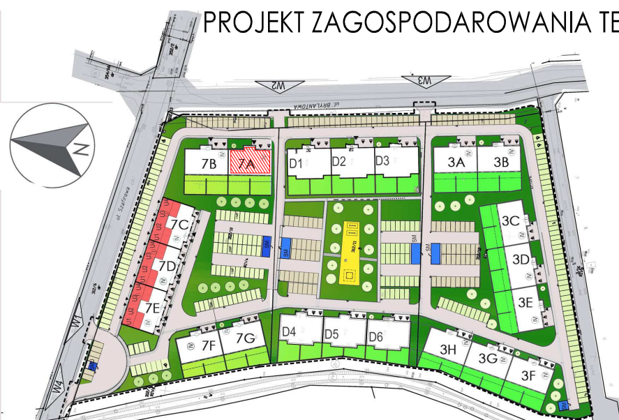
PROJEKT ZAGOSPODAROWANIA TERENU